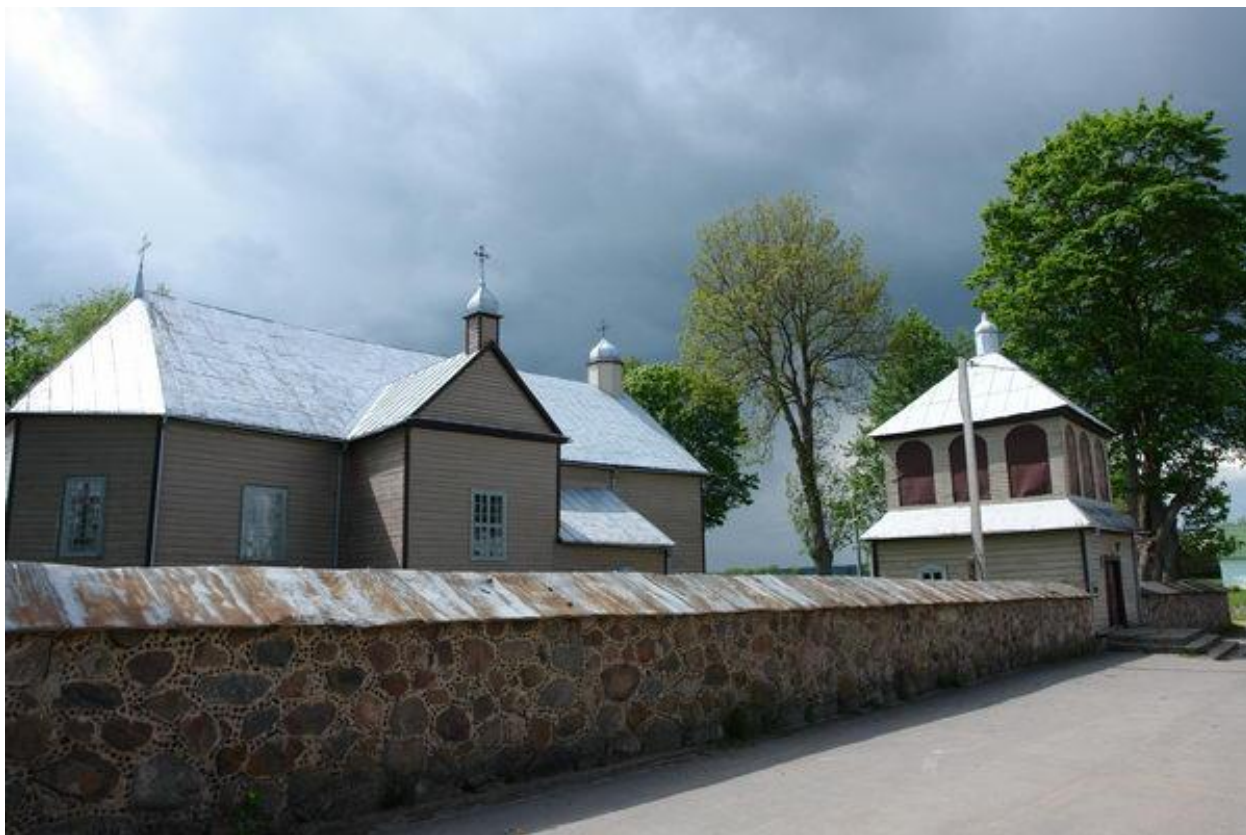
(Костел Наисветлейшей Девы Марии в Мурованой Ошмянке)

Достопримечательностью Мурованой Ошмянки является деревянный костел Наисветлейшей Девы Марии,