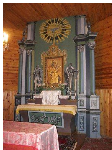
(Католическая каплица на кладбище д. Городники)