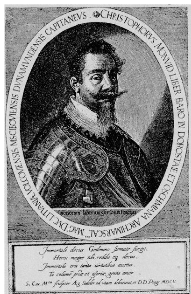
(Крыштоф Монвид Дорогостайский)

В этом учебнике по коневодству рассказано «все» о лошадях: от описания их физиологии и болезней до истории верховой езды. Уникальное издание с блеском оформил знаменитый гравер и картограф Томаш Маковский, а редактировал «Гиппику» Миколай Крыштоф Радзивил Сиротка. Переизданная семь раз, книга –раритет хранится в Национальной библиотеке Беларуси (издание 1647 года). Недавно по инициативе сотрудников конноспортивного центра «Гиппика» вышло факсимиле этой уникальной книги.