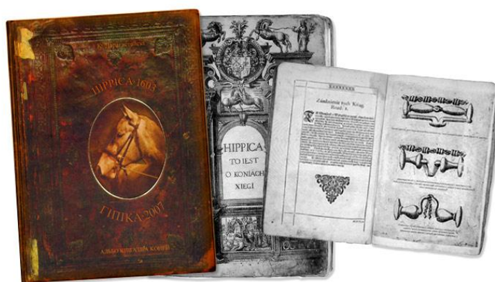
(Фотография факсимиле книги «Гиппика»)

В этом учебнике по коневодству рассказано «все» о лошадях: от описания их физиологии и болезней до истории верховой езды. Уникальное издание с блеском оформил знаменитый гравер и картограф Томаш Маковский, а редактировал «Гиппику» Миколай Крыштоф Радзивил Сиротка. Переизданная семь раз, книга –раритет хранится в Национальной библиотеке Беларуси (издание 1647 года). Недавно по инициативе сотрудников конноспортивного центра «Гиппика» вышло факсимиле этой уникальной книги.