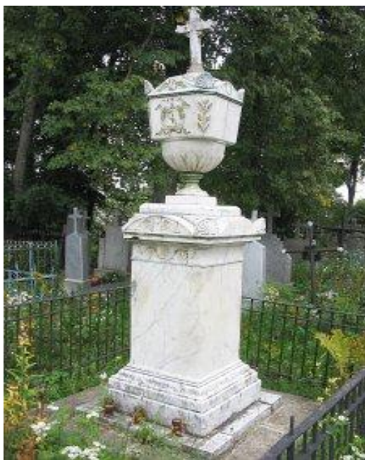
(Надгробный памятник на могиле Анджея (Енджея) Снядецкого)