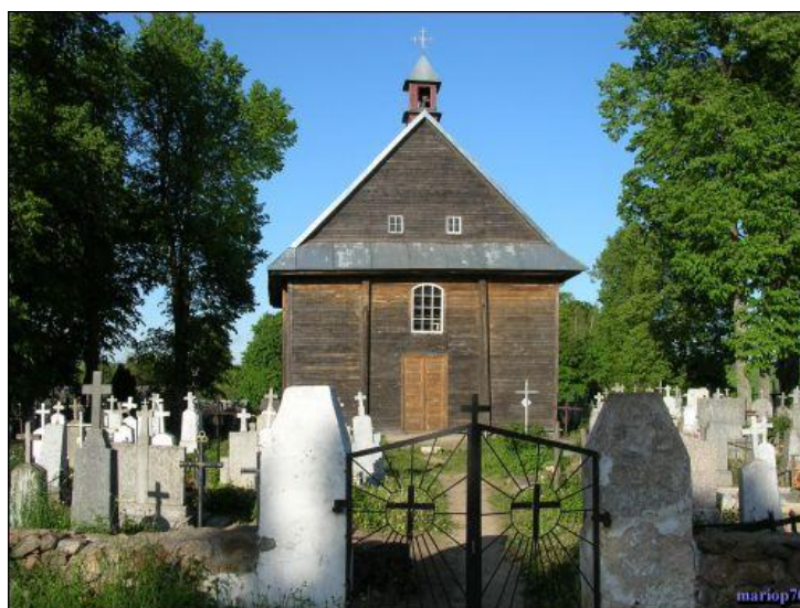
(Католическая каплица на кладбище д. Городники)

Каплица, рядом с которой находится могила Анджея (Енджея) Снядецкого (1768-1838), которого по праву называют «отцом польской химии».